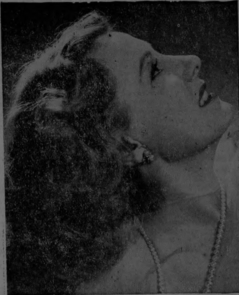
La perfecta aplicación del maquillaje es el sello de distinción que caracteriza el arreglo personal de la adorable Irene Dunne, estrella de Universal International, afirma el experto de Hollywood Max Factor Jr.

Nunca se recomendará bastante este producto a las mujeres que sufren de un exceso de grasa en la nariz. Estas mujeres deben hacerse aplicaciones de crema