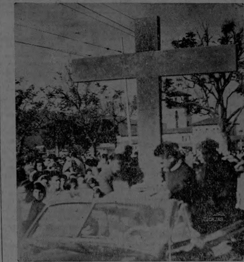
El pasado viernes llegó a San José, en una peregrinación por todos estos pueblos de América, la Santa Cruz de Jerusalén.

La madre recorría la casa con cierta nerviosidad inquietud. Sur grandes ojos claros, apagados de tanto llorar, se detenían con angustia sobre una puerta cerrada. Tras (Pasa a la Pág. DOS)