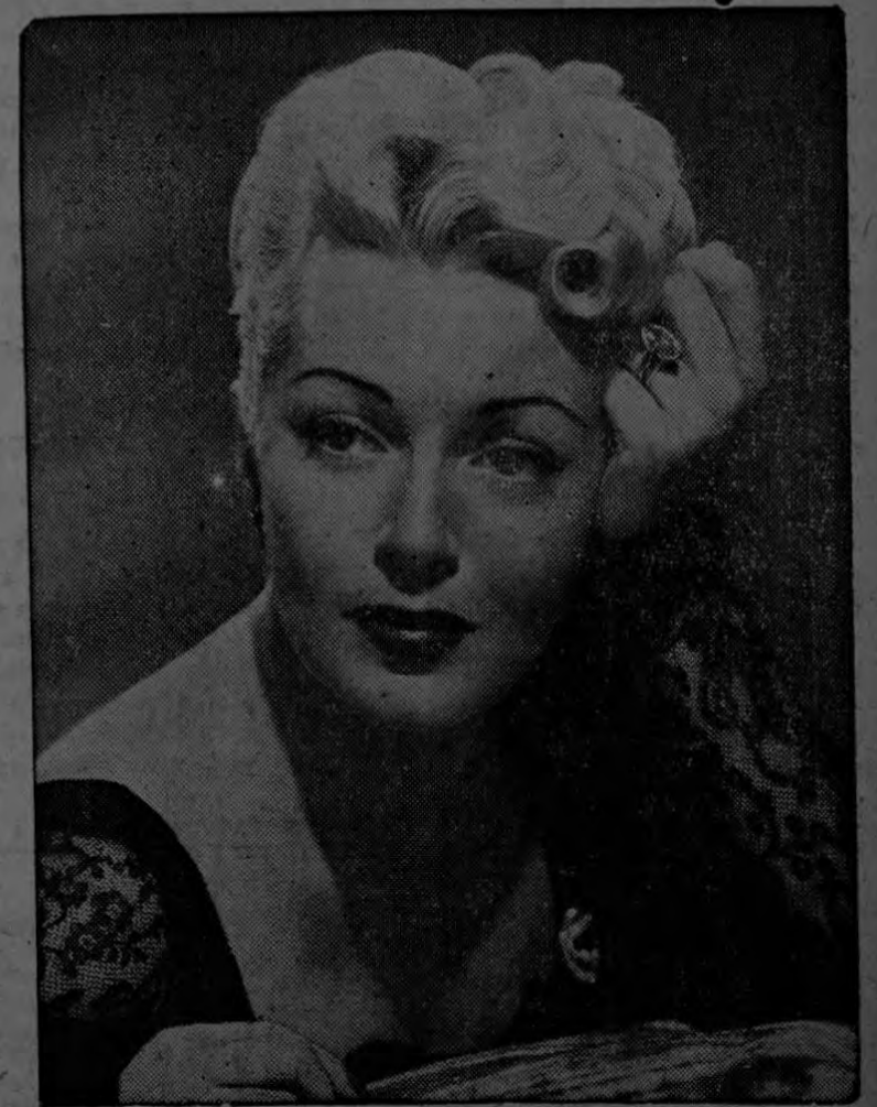
Lana Turner... Estrella de la Metro Goldwyn Mayer

¿Se ha detenido usted alguna vez a pensar cuán importante es la conjunción condicional "SI"? Puede decirse que es sinóni-